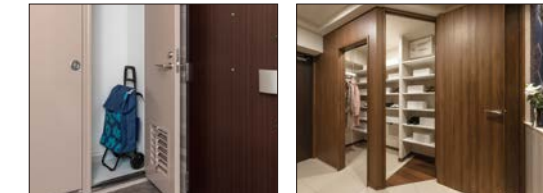
トランクルーム シューズスルー クローゼット