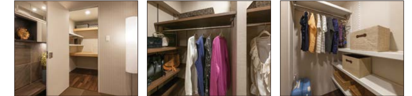
ウォークイン 押入 ウォークイン クローゼット 大容量 ファミリー収納