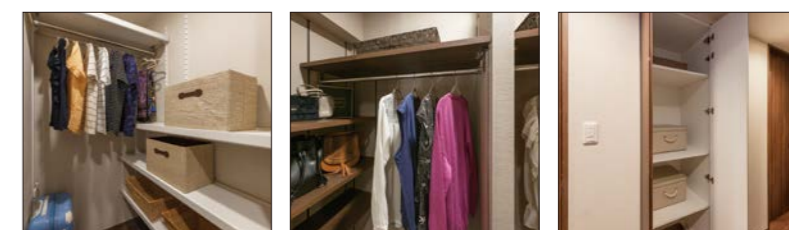
大容量 ファミリー収納