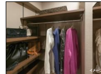
ウォークイン クローゼット