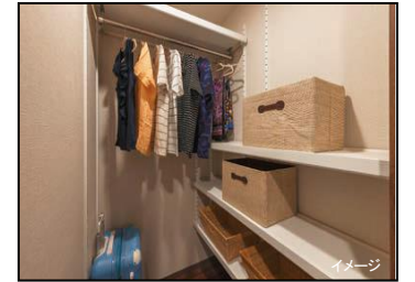
大容量 ファミリー収納