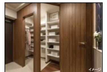
シューズスルー クローゼット